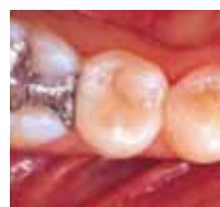
2001 Die gleiche Restauration nach sechs Jahren