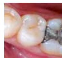
2007 Die gleiche Restauration nach zwölf Jahren