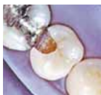
1995 Präparierte Kavität nach der Konditionierung

300 Millionen applizierte Restaurationen weltweit machen sie zum GOLD-STANDARD für Glasionomer-Restaurationen.