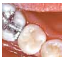
1995 Endergebnis nach Ausarbeitung und Politur